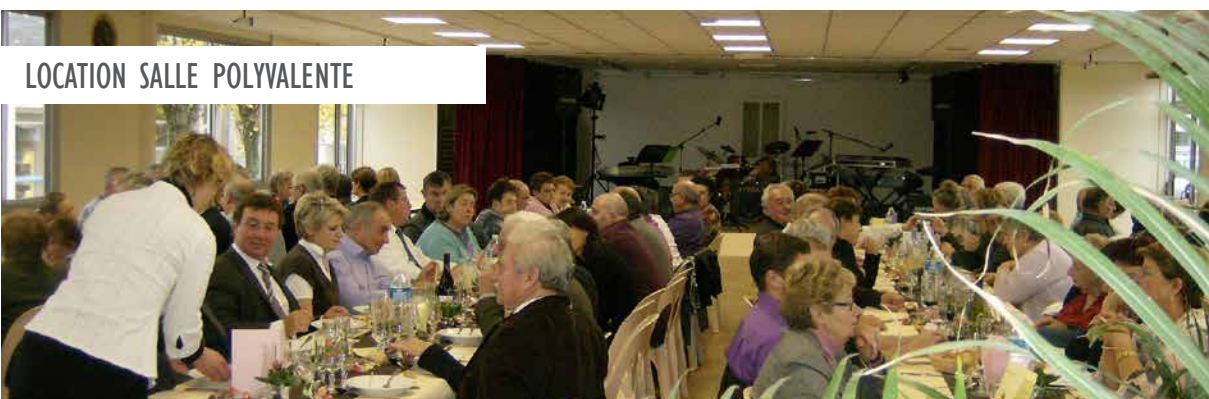
LOCATION SALLE POLYVALENTE